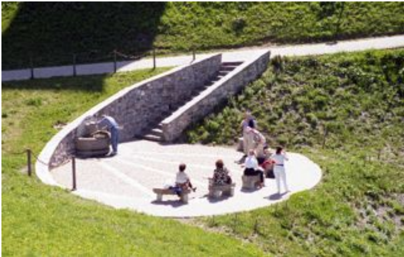
Źródelko w La Salette